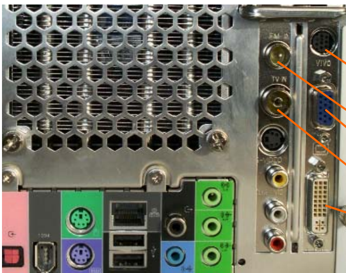
Abbildung: Analog TV-Karte und Grafikkarte auf der Rückseite des XP2C SB83G5 Media Center PCs.

Obgleich der XP2C Windows Media Center-PC vollständig ausgestattet und optimal vorkonfiguriert ist, müssen Sie zur Ausnutzung sämtlicher Funktionen externe Geräte mit dem PC verbinden. Hier geht es um das Einspeisen von Videosignalen bei einem Media Center Edition-PC. Dazu nutzen Sie die standardmässig eingebaute TV-Karte und Grafikkarte des PC's. Die korrekten Anschlüsse sind mitverantwortlich dafür, dass Sie überhaupt Fernseh- oder Radiosender empfangen und aufzeichnen können.