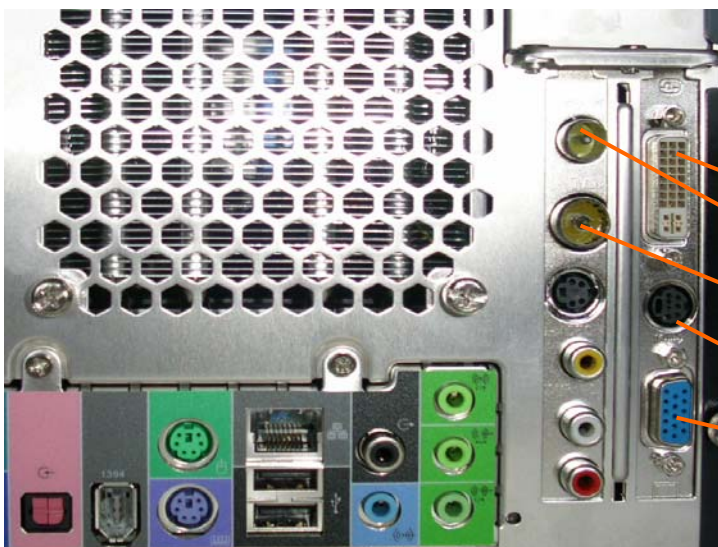
Abbildung: Analog TV-Karte und Grafikkarte auf der Rückseite des XP2C SB83G5M Media Center PCs.

Obgleich der XP2C Media Center Edition-PC vollständig ausgestattet und optimal vorkonfiguriert ist, müssen Sie zur Ausnutzung sämtlicher Funktionen externe Geräte mit dem PC verbinden. Hier geht es um das Einspeisen von Videosignalen bei einem Media Center Edition-PC. Dazu nutzen Sie die standardmässig eingebaute TV-Karte und Grafikkarte des PC's. Die korrekten Anschlüsse sind mitverantwortlich dafür, dass Sie überhaupt Fernseh- oder Radiosender empfangen und aufzeichnen können.